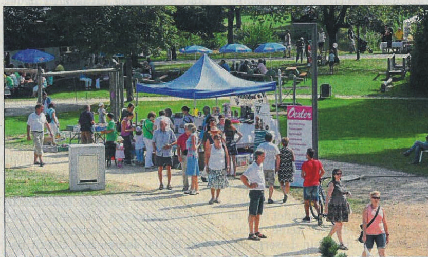
49 Stände sind beim 11. Kneippfestival am 9. September in Bad Kötzing am Start.